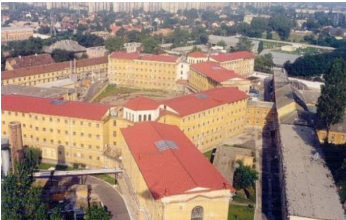
4. ábra Gyűjtőfogház